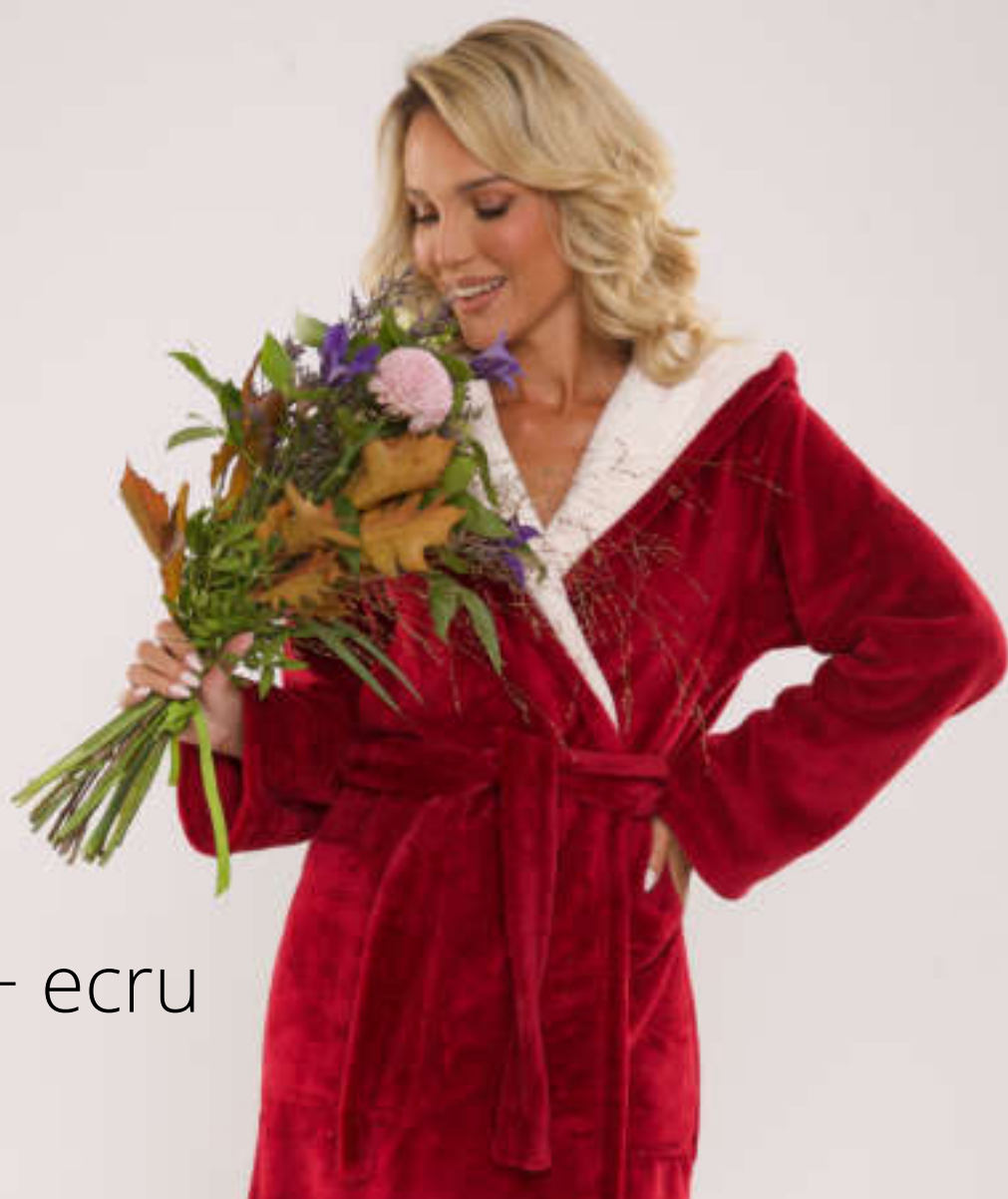
bordo + ecru