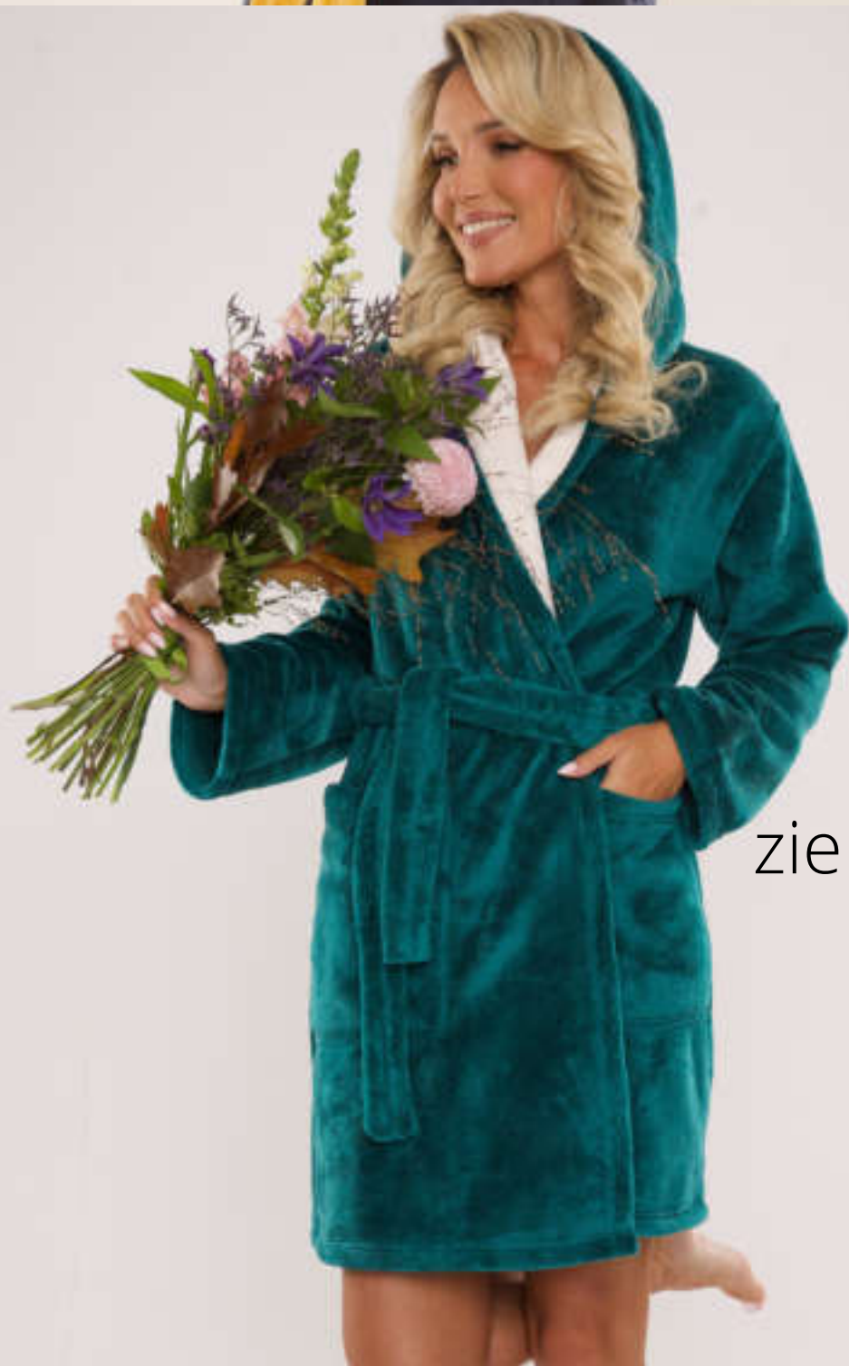
zielony + ecru