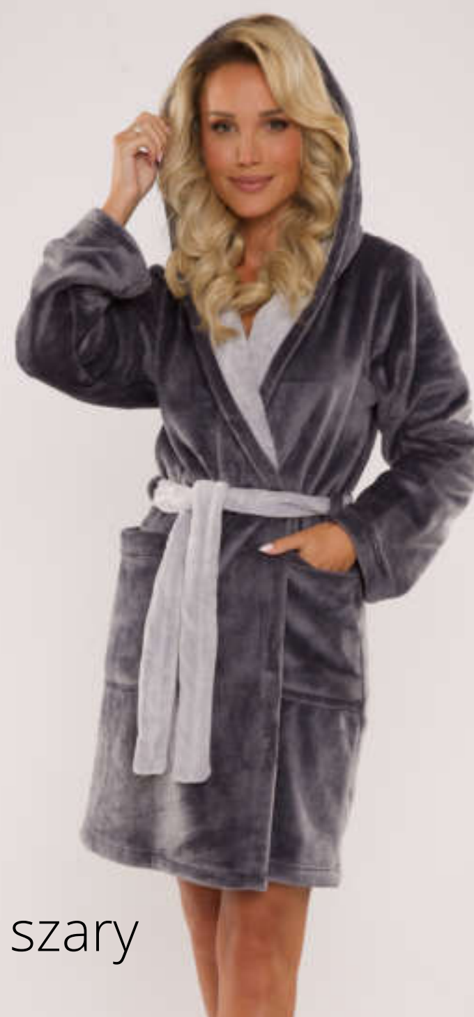
grafit + szary