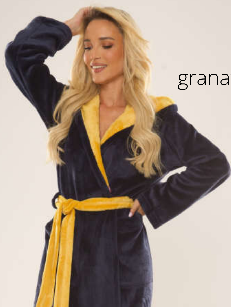
granat + miód