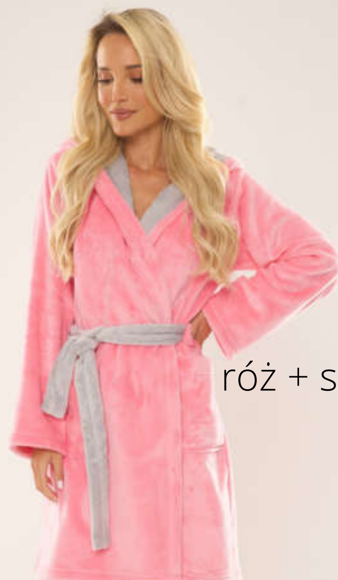
róż + szary